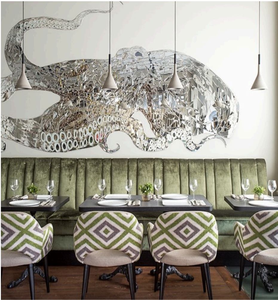
Door Mia ingericht restaurant Rombus in Moskou.