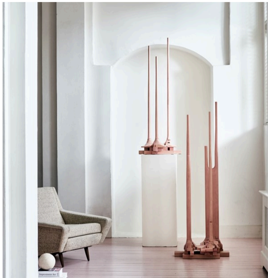
Surfaced kapstok van Japane designer Sho Ota.