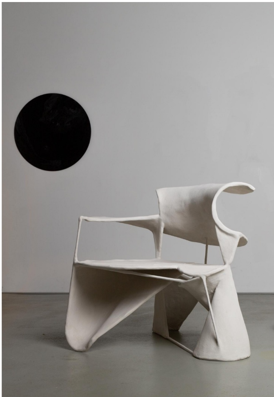
📍 La galerie Mia Karlova (Amsterdam) fait escale avec des œuvres d'artistes et designers internationaux partageant une vision poétique du design de collection du XXI e siècle. Ici « Curved sculpture chair » signée Jordan van der Ven. Mia Karlova Galerie